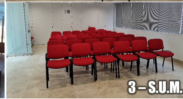
3 - S.U.M.